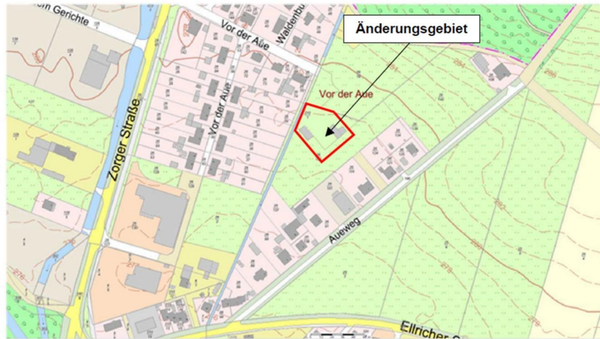
Abb. 1 Übersichtsplan der Bestandssituation

Der Geltungsbereich der 1. Änderung des vorhabenbezogenen Bebauungsplanes Nr. 16 „Aueweg“ der Gemeinde Walkenried liegt mit einer Größe von 0,24 ha in der östlichen Ortslage der Gemeinde Walkenried. Die maßgebende Abgrenzung des räumlichen Geltungsbereiches ist aus der Planzeichnung der Bebauungsplanänderung im Maßstab 1:1.000 ersichtlich.