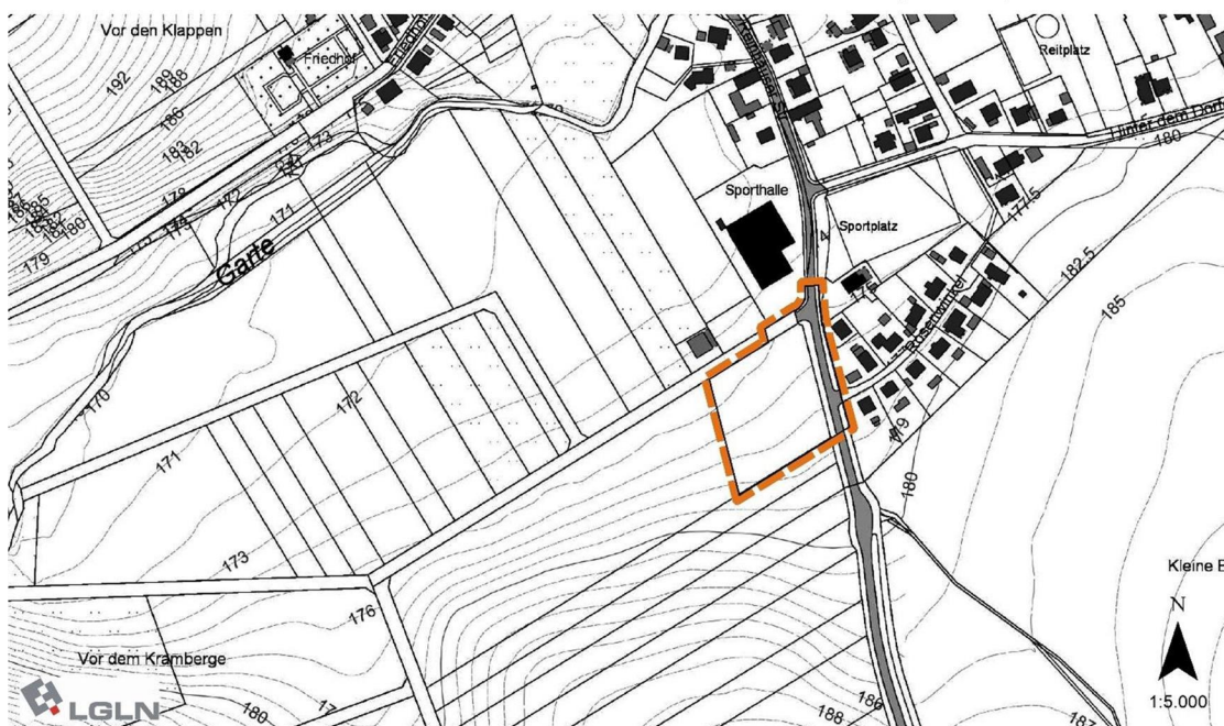
Übersichtskarte, Kartengrundlage LGLN, AK5

Der räumliche Geltungsbereich der 1. Änderung des Bebauungsplanes Nr. 89 "Grundschule Diemarden", Ortschaft Diemarden, ist in dem nachstehenden Übersichtsplan dargestellt.