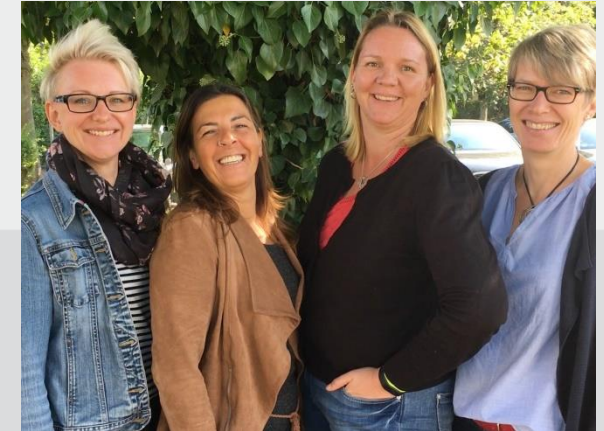
Ein Teil des Teams der Kinderschutzfachkräfte.

Berufsgeheimnisträger einen Anspruch auf Beratung auf Beratung durch eine insoweit erfahrenen Fachkraft.