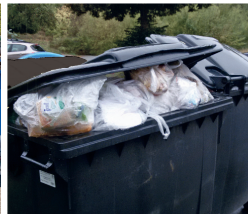
Das ist keine Lösung: Die Behälter sind einfach zu klein oder es sind zu wenige für die Wohnanlage. Die Deckel müssen immer schließen können.