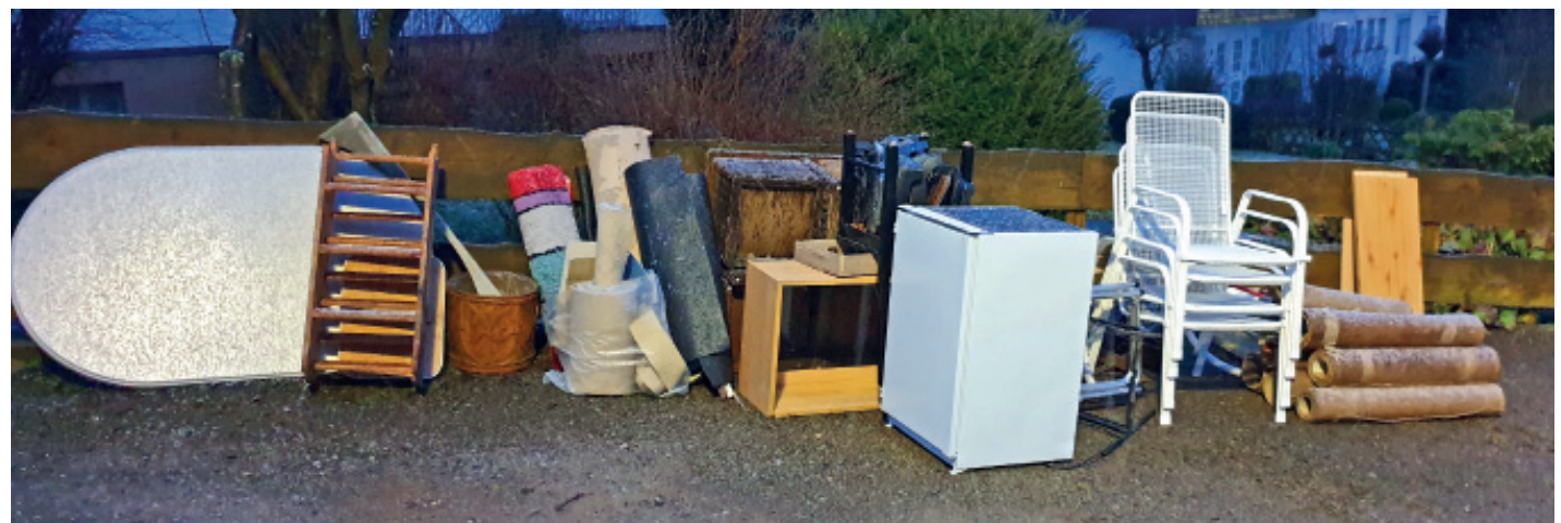
Übersichtlich: Der Sperrmüll liegt sortiert nach Holz und Elektrogeräte und sonstiger Abfall getrennt am Straßenrand. Dieses Foto entstand im Winter.

Nach Anmeldung von Sperrmüll – online oder per Postkarte – wird der Termin in den folgenden vier Wochen stattfinden. Wird eine gebührenpflichtige Leistung, wie ein Wunschtermin, die Eilabholung oder die Abholung aus Wohnung oder Haus benötigt, wird dieses per Formular beantragt. Dieses ist auf der