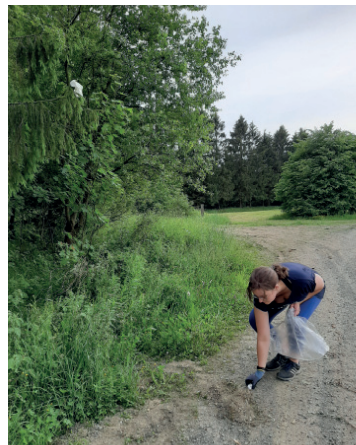
Wer beim Wandern oder Joggen Abfall am Wegesrand sieht, nimmt ihn einfach mit.

Erfahrene Plogger*innen haben daher stets einen Beutel und Handschuhe dabei. Seit 2016 erfreut sich dieser Sport