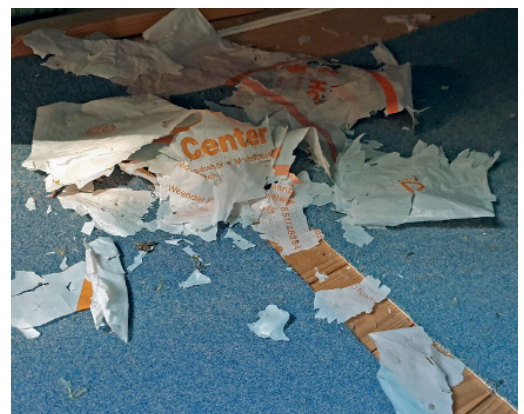
Eine alte Plastiktüte ist nach Jahren so spröde geworden, dass sie in Flocken zerfallen ist.

Kaffeefilter) können zusätzlich in Küchenkrepp oder Zeitungspapier eingewickelt oder getrocknet werden.