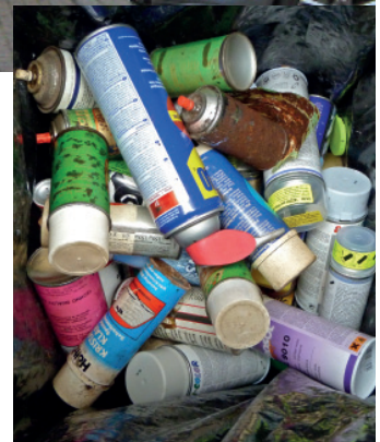
Spraydosen verschiedener Art haben oft umweltschädlichen Inhalt.

Auskünfte und Informationen zur Abfallvermeidung, -verwertung und -entsorgung gibt es unter der Telefonnummer 0551 525-2473 und per E-Mail abfallberatung-goe@landkreisgoettingen.de sowie auf www.landkreisgoettingen.de , Menüpunkt „Abfallwirtschaft Göttingen“.