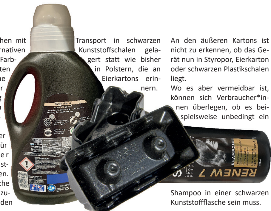
Shampoo in einer schwarzen Kunststoffflasche sein muss.