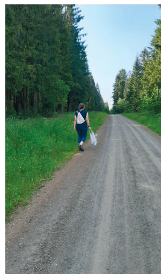
Das Wandern ist hier eindeutig die Hauptbeschäftigung.

Wer ungerne joggt, probiert es vielleicht mit „Pliking“ („plocka“ und „hiking“, englisch für „wandern“).