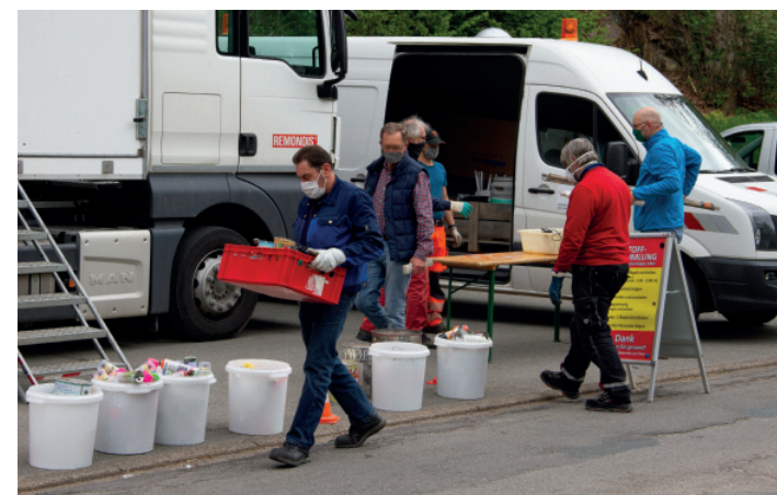
Wenn auch mit Mund-Nasenschutz, funktioniert die Schadstoffannahme problemlos.