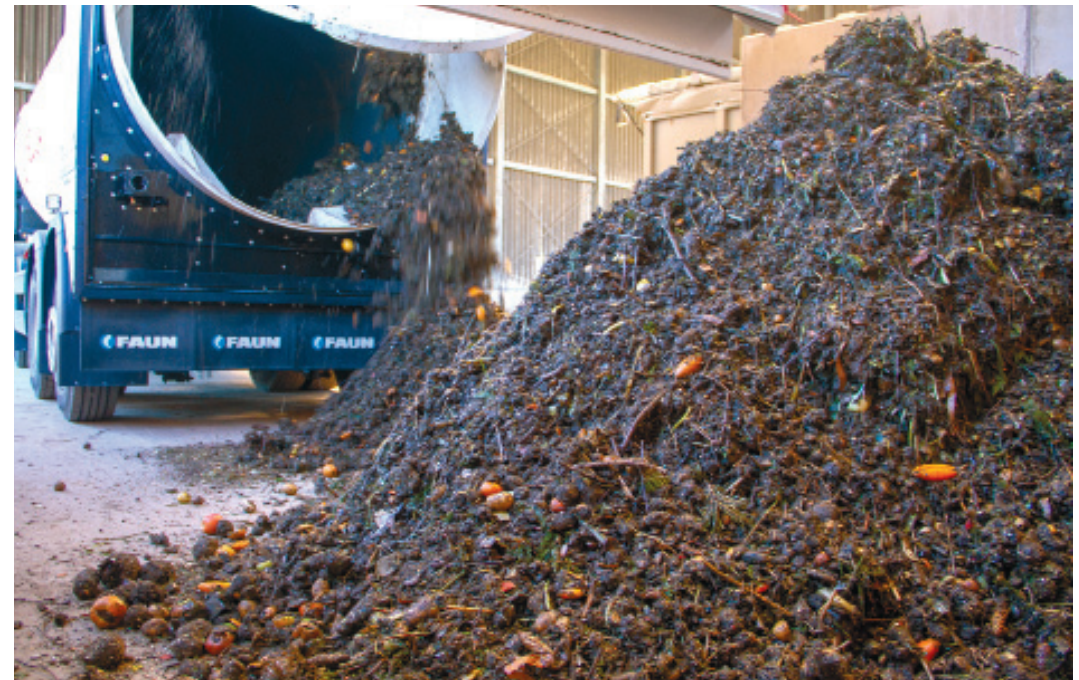
Das kann sich sehen lassen: Der Inhalt aus Komposttonnen ist weitgehend von Störstoffen frei. Die Qualität wird nach der „Reinheit“ des Rohstoffes für Kompost definiert. Plastik jeder Art stört sehr.

Wenn auch sehr vereinfacht dargestellt, macht es doch das Problem klar: Kunststoffe sind nicht kompostierbar. Das gilt