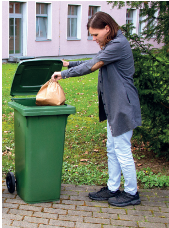
Wer eine saubere grüne Tonne haben will, wirft die Bioabfälle mit einer Papiertüte oder eingewickelt in Zeitungspapier in den Behälter. Das schützt im Sommer auch vor üblen Gerüchen.