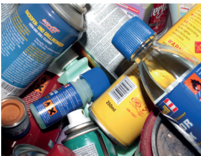
Gefahrstoffsymbole zeigen an, dass die leeren Behälter über die Schadstoffsammlung entsorgt werden müssen.

... und ganzjährig im Schadstoffsammellager der Entsorgungsanlage Deiderode an Werktagen mittwochs von 08:00 bis 15:00 Uhr und samstags von 10:00 bis 12:00 Uhr (von November bis Februar nur an jedem 1. Samstag im Monat)