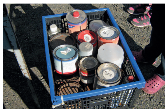
Dosen mit alten Lackfarben, Nitroverdünnern, Vorstreichfarben oder Grundierungen nimmt die Schadstoffsammlung entgegen.