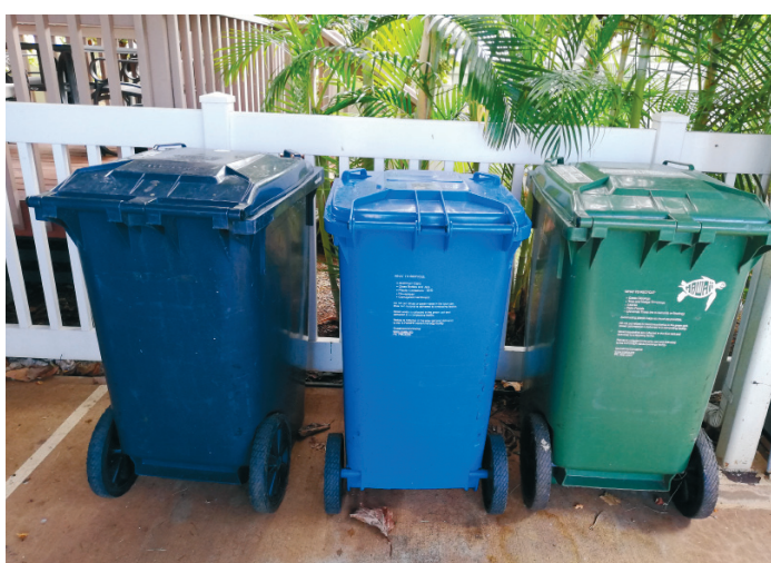
An einem Wohnhaus in Honolulu

In der grauen Tonne werden alle sonstigen Abfälle gesammelt, also der Restabfall.