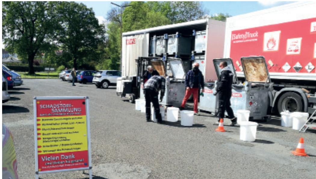
Die Schadstoffsammlung mit besonderen Verhaltensregeln wegen Corona-Infektionsgefahr

Lösungen mussten oft sehr schnell und pragmatisch gefunden werden. Auch die kommunalen Abfallwirtschaften sehen sich vielfältigen Problemstellungen ausgesetzt. Verfügte Kontaktbeschränkungen führten zur Absage von Samm-