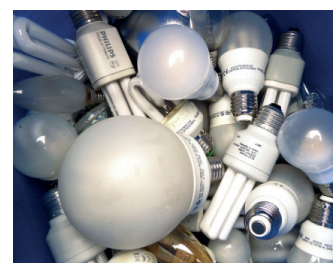
Energiesparlampen enthalten problematische Substanzen wie Quecksilber.

Auskünfte und Informationen zur Abfallvermeidung, -verwertung und -entsorgung gibt es unter der Telefonnummer 0551 525-2473 und per E-Mail abfallberatung-goe@landkreisgoettingen.de sowie auf www.landkreisgoettingen.de , Menüpunkt „Abfallwirtschaft Göttingen“.