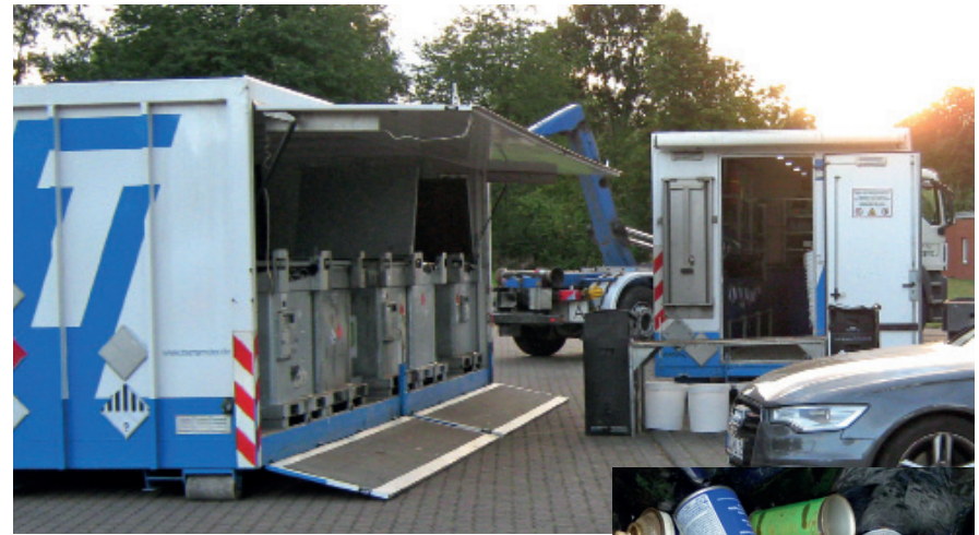
Die mobile Schadstoffsammelstation kommt für 90 Minuten in elf Orte des Altkreises Göttingen.

Kühl- und Tiefkühlgeräte dürfen nur bei der Entsorgungsanlage Deiderode (EAZD) abgegeben werden. Nur dort ist die Lagerung der Geräte mit den klimaschädlichen Treibgasen möglich.