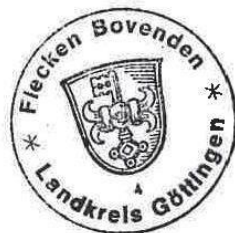
..... Bürgermeister Brandes